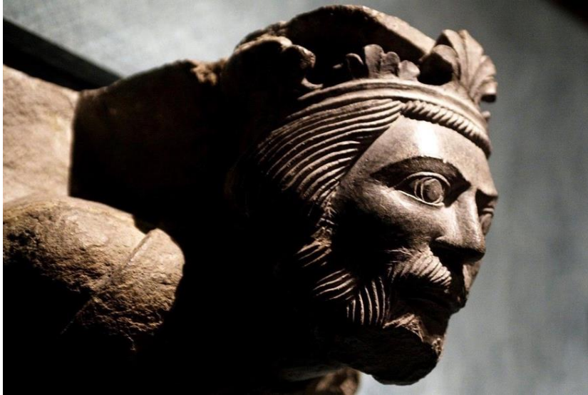
Skulptur i Nidarosdomen av det som trolig skal forestille kong Sverre.