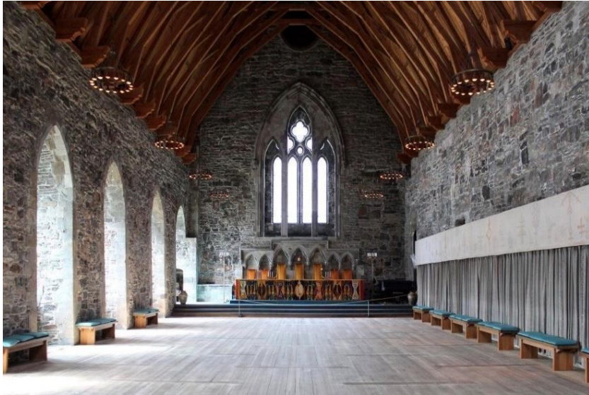
Gildesalen i Håkonshallen i Bergen.