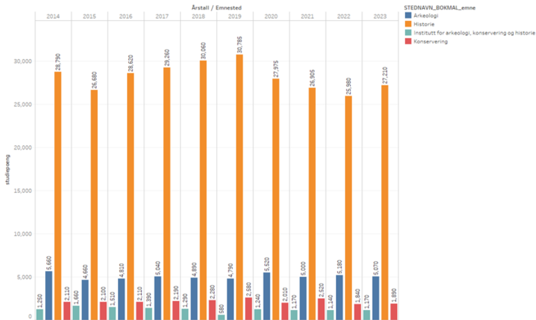
Figur: Studiepoengsproduksjonen 2014-2023