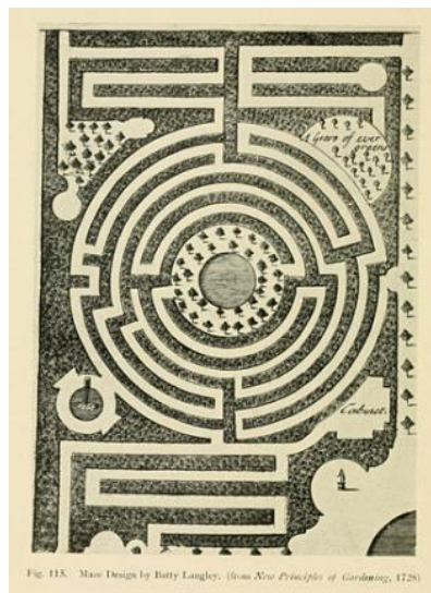
Fig. 115. Maze Design by Battis Langley, (from New Principles of Gardening , 1728)