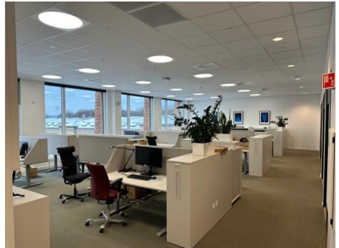
Kontorlandskap - vi har fire områder i ulik størrelse