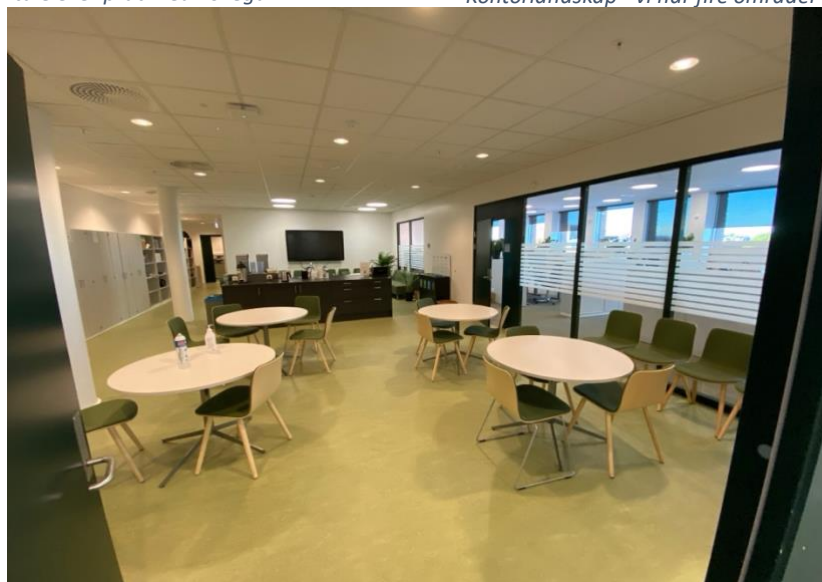
Den sosiale sonen vår