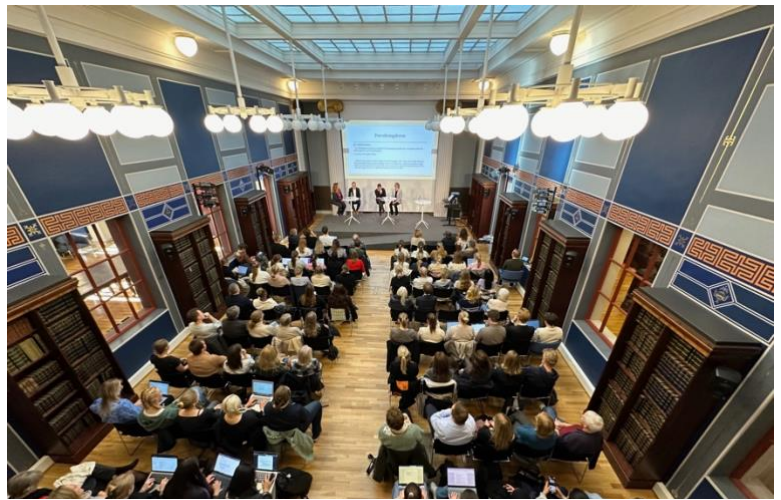
Fra formidlingsarrangement i Domus Bibliotheca der kommunikasjon bidrar både i forkant og under arrangementet.