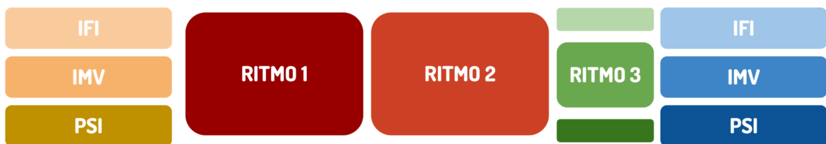
Figur 2: Skjematisk fremstilling av RITMOs oppbygging, overgangsperiode og innfasing.

En slik tidslinje (som skissert i Figur 2) vil sikre nødvendig avslutning av pågående RITMO-aktiviteter og en god innfasing ved de respektive instituttene. Ikke minst vil det sikre at de fast vitenskapelig ansatte får tilstrekkelig tid til å “høste fruktene” av senterets aktiviteter gjennom å gjøre ferdig publikasjoner og datasett og utvikle nye prosjekter og samarbeidsflater, både når det gjelder forskning og utdanning.