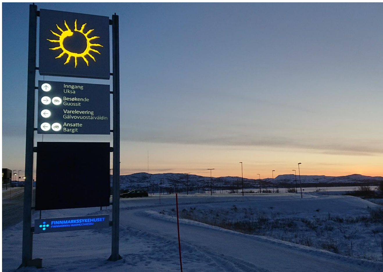
Bilde 5: Finnmarkssykehuset. Tekst på norsk og nordsamisk. «Inngang. Besøkende. Varelevering. Ansatte.»