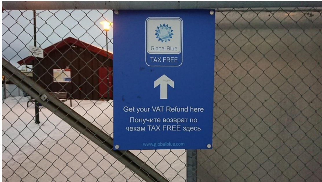
Bilde 6: Skilt i sentrum. Tekst på engelsk og russisk. «Global Blue. Tax Free. Get your VAT Refund here».