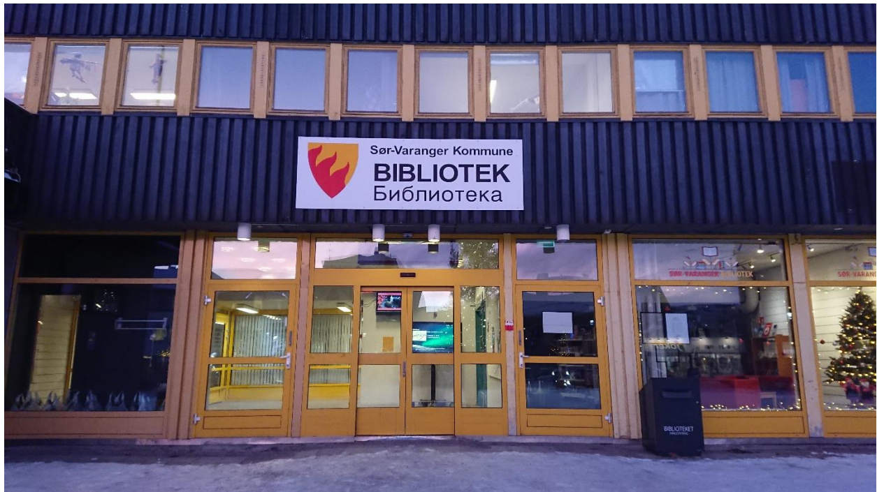
Bilde 1: Biblioteket i Kirkenes. Tekst på norsk og russisk.