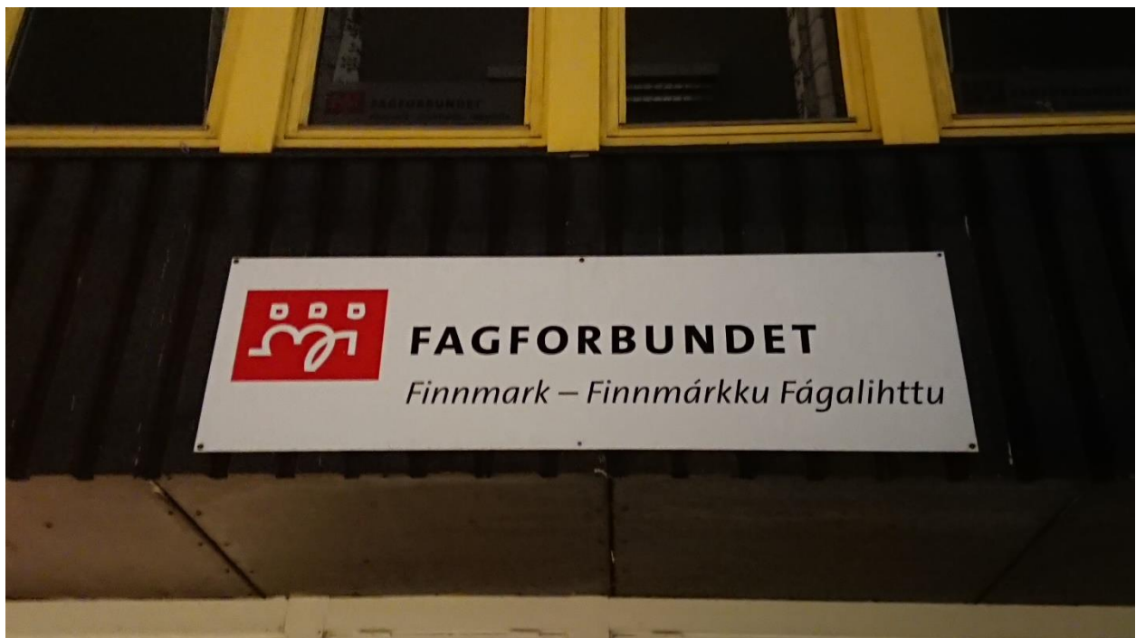
Bilde 2: Fagforbundet. Tekst på norsk og nordsamisk.