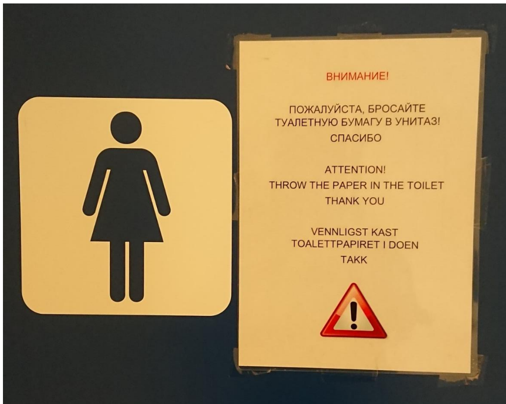
Bilde 7: Oppslag i kjøpesenter. Tekst på russisk, engelsk og norsk. «Vennligst kast toalettpapiret i doen. Takk.»