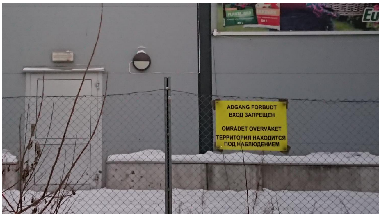
Bilde 4: Skilt bak butikk. Tekst på norsk og russisk. «Adgang forbudt. Området overvåket.»